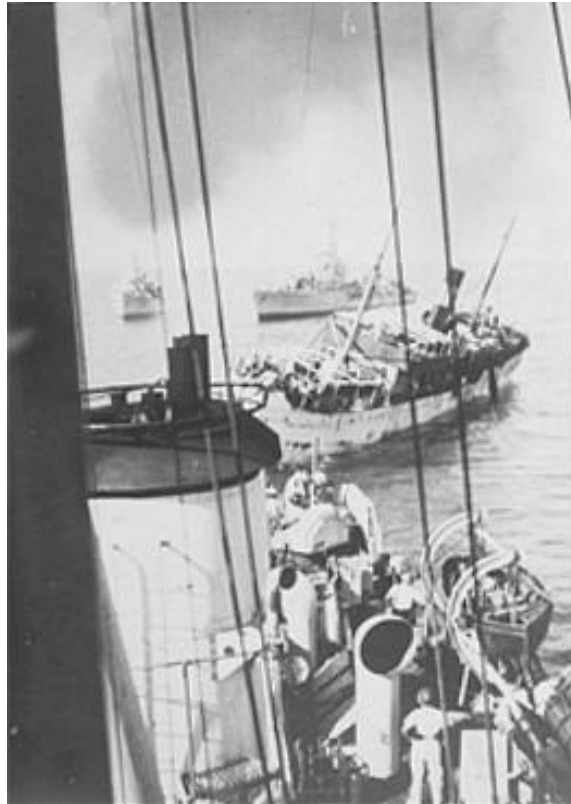
'לטרון' מוקפת במשחתות הצי הבריטי