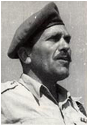
אימי בשרותו הצבאי