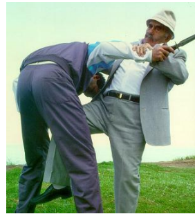
אימי בהדגמה כנגד סכין

הערת מערכת: אימי שדאור ליכטנפלד התפרסם בעולם כמפתח שיטת הלחימה וההגנה העצמית "קרב מגע"; הקש כאן לפרטים מאתר ויקיפדיה.