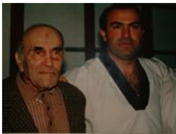
אימי בערוב ימיו

ב- 1964 פשט את המדים והחל ללמד תורתו לאזרחים ולגופים ציבוריים שונים.