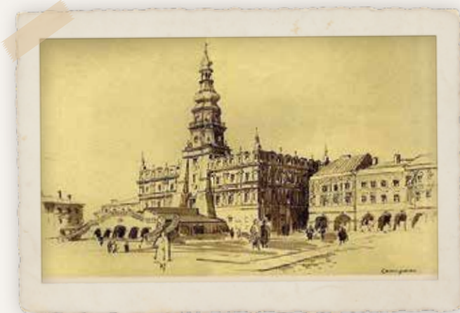
איור של כנר העיר בז'אמושץ