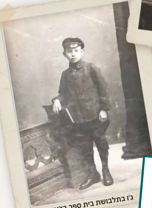
ג'ו בתלבושת בית ספר בז'אמושץ

כשניים וחצי מליון יהודים ממזרח אירופה היגרו לאמריקה בשלהי המאה שעברה ובראשית המאה הזאת. הם הגיעו כאניות עמוסות והתנסו בהליכי הגירה נוקשים ומכזיבים. רבים מהם התיישבו באזור הדרומי-מזרחי של העיר ניו-יורק והשתילו שם את אורח החיים של השטעטל המזרח-אירופי. הם עבדו כזכנים כרוכלים וכחייטים. הם חיו בסביבה יהודית, שפתם היתה יידיש, הם הקימו ארגונים עצמאיים לפי ארצות מוצאם ובנו בתי-כנסת משלהם.