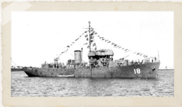
אוניית חיל הים ק-18 שמרה את הכינוי "ווג'וד" מקושטת לכבוד יום העצמאות, 1949