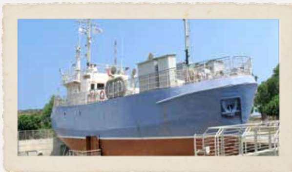
דגם של אוניית מעפילים שהוצבה במוזיאון ההעפלה בעתלית בסיוע קרן בוקסנבאום-נטע