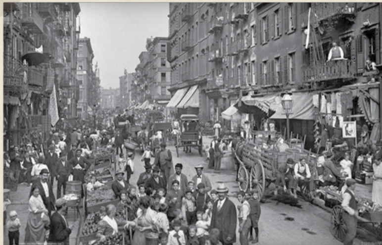
רובע יהודי במנהטן

כשניים וחצי מליון יהודים ממזרח אירופה היגרו לאמריקה בשלהי המאה שעברה ובראשית המאה הזאת. הם הגיעו כאניות עמוסות והתנסו בהליכי הגירה נוקשים ומכזיבים. רבים מהם התיישבו באזור הדרומי-מזרחי של העיר ניו-יורק והשתילו שם את אורח החיים של השטעטל המזרח-אירופי. הם עבדו כזכנים כרוכלים וכחייטים. הם חיו בסביבה יהודית, שפתם היתה יידיש, הם הקימו ארגונים עצמאיים לפי ארצות מוצאם ובנו בתי-כנסת משלהם.