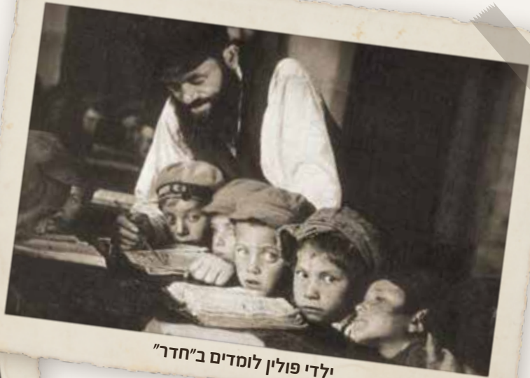
ילדי פולין לומדים ב"חדר"