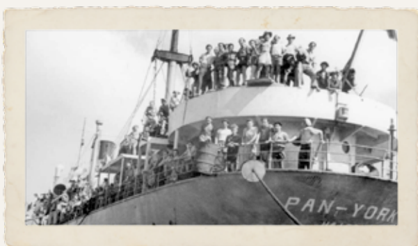
אוניית המעפילים "קיבוץ גלויות" (קוממיות), לשעבר Pan-York, נמל חיפה 1947

לאחר שהפליגו האניות בכיוון לארץ ובהיותן עמוסות בנשים ותינוקות, סוכם עם הבריטים למנוע התנגשויות בלב ים והן הפליגו ישירות לקפריסין.