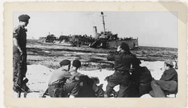
"חיים ארלזורוב" על שרטון בחוף בת גלים, חיפה, 1947