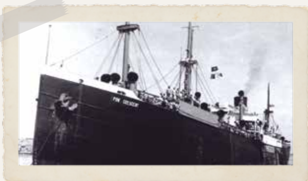
אוניית המעפילים "עצמאות" (Pan-Crescent), מרסיי 1947